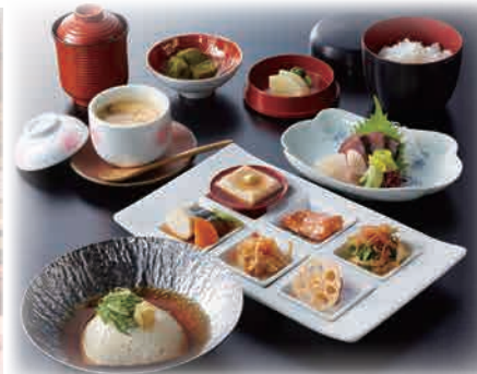
酒蔵ご膳 料理イメージ